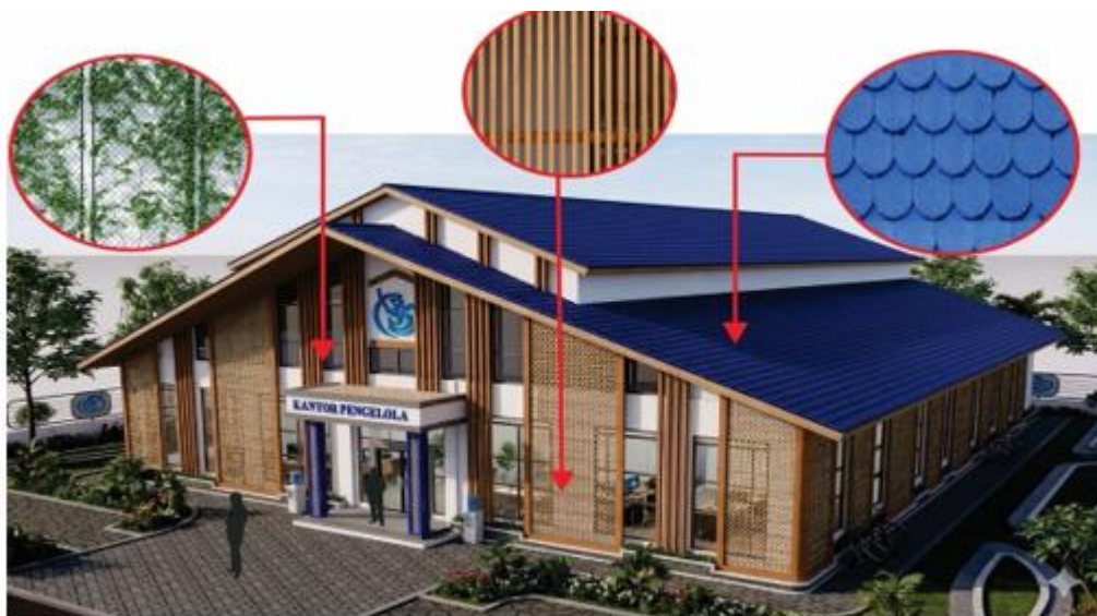
Gambar 3. Konsep Tampilan Bangunan dan Material.

Pada interior bangunan, lantai menggunakan parket kayu, dinding difinishing dengan cat berbahan dasar rendah VOC, dan plafond menggunakan bahan yang mendukung kenyamanan termal.