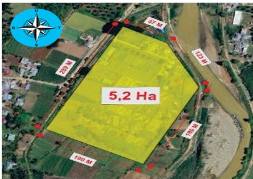
Gambar 1. Lokasi dan Konteks Tapak Terpilih Sentra Budidaya Ikan Air Tawar, Desa Suka Damai, Kabupaten Bone Bolango.

Kawasan sentra budidaya dibagi ke dalam empat zona utama yang ditata secara hierarkis berdasarkan tingkat privasi dan aksesibilitas. Zona publik yang mencakup area penerimaan, parkir, minimarket, dan kolam pemancingan ditempatkan di bagian depan kawasan (sisi barat) yang berdekatan dengan akses jalan utama. Zona semi-publik yang meliputi restoran, aula, laboratorium, dan ruang terbuka hijau diposisikan di tengah kawasan sebagai penghubung antara area publik dan privat. Zona budidaya yang merupakan inti kawasan ditempatkan di bagian dalam, berjauhan dari kebisingan eksternal. Zona penunjang yang mencakup gudang pakan, rumah dinas, fasilitas MEP, dan pos jaga diletakkan pada posisi strategis yang mendukung operasional budidaya.