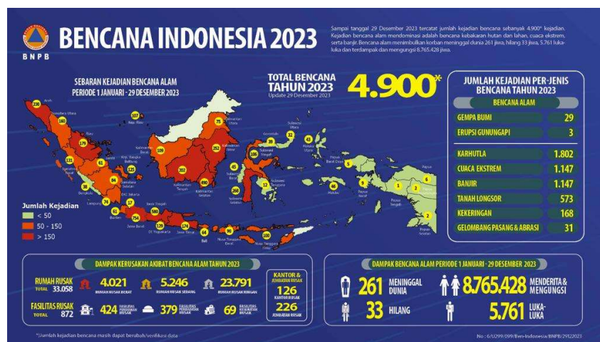
Gambar 1. Sebaran Kejadian Bencana Alam Periode 1 Januari – 29 Desember 2023

Berdasarkan data dari Badan Nasional Penanggulangan Bencana (BNPB) melalui data bencana Indonesia tahun 2023 periode 1-29 Desember 2023, total bencana yang terjadi di Indonesia berjumlah 4900 kejadian bencana. Bencana tersebut menyebabkan banyak dampak seperti korban jiwa, luka-luka, hilang, mengungsi dan merusak rumah-rumah maupun fasilitas publik. Data tertinggi menunjukkan bahwa 4 bencana yang sering terjadi adalah bencana Karhutla yang berjumlah 1.802 kejadian, kemudian cuaca ekstrim 1.147 kejadian, Banjir 1.147 kejadian dan tanah longsor 573 kejadian. Sementara itu per Januari tahun 2024 total bencana yang terjadi di Indonesia adalah 153 kejadian dengan didominasi bencana hidrometeorologi.