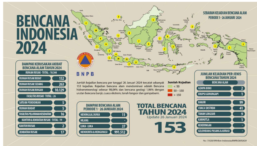
Gambar 2. Sebaran Kejadian Bencana Alam Periode 1 Januari – 26 Januari 2024