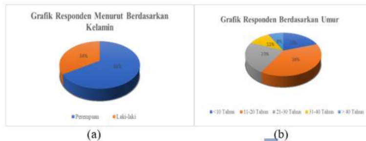
Gambar 3. (a) Persentase responden berdasarkan jenis kelamin; (b) Persentase Responden Berdasarkan Umur;

Gambar 3 (a), menunjukkan bahwa sebagian besar pengunjung yang paling banyak mendominasi dipemandian waterpark matua adalah perempuan dengan tingkat persentase mencapai 66%, sedangkan laki-laki tingkat persentasenya 34%.