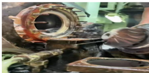
Gambar 4 Pergantian Turbo Charger