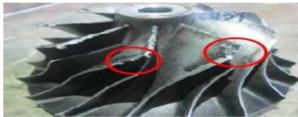
Gambar 2 kropos kompresor wheels

Keroposnya pada kompresor dapat disebabkan oleh banyak faktor, salah satunya adalah kurangnya perawatan dan Jika material yang digunakan untuk membuat roda kompresor tidak berkualitas baik, maka korosi atau degradasi material dapat terjadi lebih cepat,turbo yang sering mengalami keuasan dikarenakan kualitas oli yang buruk, bisa juga dari lingkungan yang banyak debu yang masuk mengakibatkan kelembapan yang tinggi mengakibatkan kroposnya compressor wheels ini