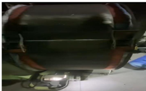
Gambar 3 Kotornya Kapas Filter Turbo

Filter udara yang tersumbat oleh debu dan kotoran mengurangi jumlah udara bersih yang masuk ke mesin. Hal ini menyebabkan campuran udara-bahan bakar tidak optimal, menurunkan efisiensi pembakaran, dan menurunkan RPM dan kemungkinan ada kebocoran pada filter udara