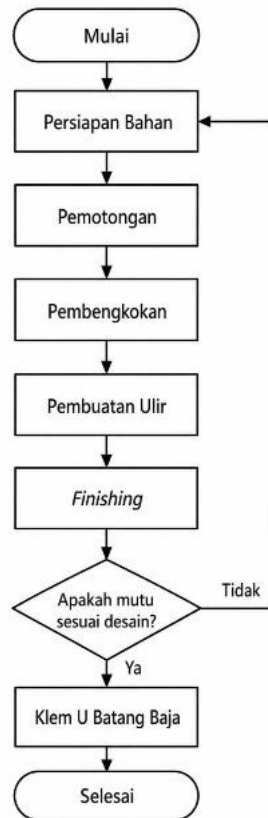
Gambar 2. Diagram Alir Manufaktur Klem U Batang Baja.

Parameter yang diamati pada proses pembuatan klem U batang baja meliputi panjang total, lebar bukaan, kesimetrisan kaki klem, panjang ulir, kecocokan mur M10, dan waktu proses produksi. Pengukuran dimensi dilakukan menggunakan mistar sorong dan penggaris baja, sedangkan pemeriksaan ulir dilakukan dengan memasang mur M10 secara langsung pada kedua ujung klem. Waktu proses dicatat mulai dari pemotongan bahan, pembengkokan, pembuatan ulir, finishing , hingga pemeriksaan akhir.