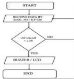
Gambar 12 Flowchart Perancangan Sistem

Berdasarkan flowchart perancangan system , maka prinsip kerja dari perancangan sistem pada penelitian ini adalah pada saat terjadinya gempa atau getaran yang dapat mengakibatkan bahaya. Sensor getar tersebut akan mengirimkan sinyal kepada buzzer dan lampu LED, serta ketika terjadi hilangnya arus listrik pada saat kejadian maka power akan di supply melalui power supply 9V yang terdapat pada rancangan. Jika terdapat percikan api atau asap yang merupakan sumber dari kebakaran maka sensor api juga akan terpicu dan membunyikan buzzer yang ada di dalam rangkaian.