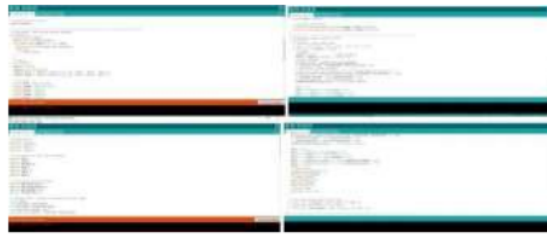
Gambar 18 Coding pada Arduino Uno

Pada pemrograman, coding digunakan untuk menetapkan batas nilai perintah yang disimpan di Arduino Uno . Pada software ini peneliti menggunakan Arduino Uno untuk pemrograman. Software Arduino Uno bekerja dengan baik dalam melakukan perintah pada buzzer , LCD, Lampu 220V . setelah semua terhubung ke Arduino Uno , peneliti mengatur jarak baca pada yang akan ditampilkan pada tampilan LCD dengan menggunakan software Arduino Uno . Di dalam gambar 4.4 merupakan coding yang penulis gunakan dalam memprogram Arduino Uno .