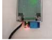
Gambar 25 Relay aktif