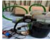
Gambar 26 Air coolant pada selang melewati flowmeter

Air coolant terlihat mengalir menuju tangki radiator melawati flowmeter sensor untuk mengetahui volume debit air coolant yang nantinya masuk ke tangki radiator . Di pompa dari tangki sumber air ke tangki radiator. Bentuk fisik air coolant pada selang melewati flowmeter dapat dilihat pada gambar 26.