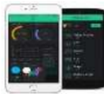
Gambar 10 Blynk

Blynk adalah platform internet of things (IoT) yang memungkinkan Anda mengendalikan perangkat elektronik melalui ponsel pintar. Penggunaanya untuk menganalisis, mengumpulkan, dan tindakan atas pembacaan data sensor dan actuator. Dengan menggunakan aplikasi Blynk anda dapat membuat antarmuka pengguna yang sederhana untuk mengontrol berbagai jenis perangkat, seperti lampu, kipas, sensor, dan banyak lagi. Bentuk fisik dari blynk dilihat dari gambar 10.