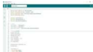
Gambar 23 Program software esp 12f

Dari program diatas membaca ketinggian sensor ultrasonic , membaca sensor flowmeter dan pompa. Dan datanya diolah di mikrokontroler arduino uno.