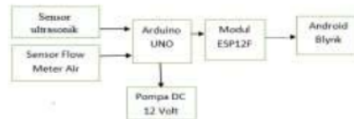
37 Gambar 12 Block diagram perancangan alat

Pada penelitian tugas akhir ini memiliki rancangan penelitian yang akan dibuat dari beberapa bagian yang dapat digambarkan blok diagram pada gambar 12