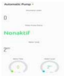
Gambar 27 Grafik volume dan debit air 2 cm pada aplikasi blynk

Tampilan grafik menunjukkan ketinggian volume air coolant 2 cm membuktikan bahwa aplikasi blynk menampilkan grafik pengisian air coolant dengan baik. Sebagaimana pada gambar 27 menunjukkan grafik volume dengan baik.