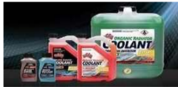
Gambar 3 Air coolant radiator

Air coolant biasanya adalah campuran air dan bahan kimia pelindung. Seperti etilena glikol atau propilena glikol, yang meningkatkan titik didih dan menurunkan titik beku cairan. Selain itu cairan pendingin ini juga mengandung inhibitor korosi untuk melindungi bagian logam dari korosi dan karat. Bentuk fisik dari air coolant dapat dilihat dari gambar 3.