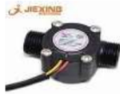
Gambar 6 Flow Meter Sensor

Flow Meter sensor adalah alat pengukur yang digunakan untuk mengukur laju aliran atau jumlah air yang melewati suatu saluran atau pipa tertentu. Alat ini biasanya memiliki berapa desain dan prinsip kerja, tujuan utamanya adalah untuk memberikan informasi tentang seberapa banyak air yang mengalir pada waktu itu. Bentuk fisik dari flowmeter sensor dapat dilihat dari gambar 6.