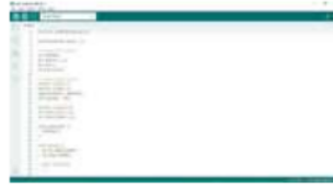
Gambar 22 Program software arduino uno

Dari program diatas membaca ketinggian sensor ultrasonic , membaca sensor flowmeter dan pompa. Dan datanya diolah di mikrokontroler arduino uno.