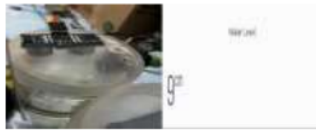
Gambar 17 Uji coba sensor ultrasonic

Pengujian sensor ultrasonic yang mana terhubung dengan arduino uno sebagai peranan sensor ultrasonic sebagai pengukur tinggi dan rendahnya air yang datanya akan ditampilkan diaplikasi blynk .