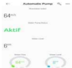
Gambar 21 Uji Coba Aplikasi blynk

Pengujian ini memonitoring data pada prototype menggunakan software berupa aplikasi blynk . Blynk diprogram dengan menggunakan hardware mikrokontroler arduino uno yang terhubung dengan module ESP12F yang memonitoring data pengisian pada tangki radiator. Bentuk fisik dari aplikasi blynk dapat dilihat dari gambar 21.