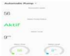
Gambar 31 Grafik volume 9 cm diaplikasi blynk

Pada grafik menunjukkan ketinggian volume air coolant 9 cm membuktikan bahwa aplikasi blynk menampilkan grafik mencapai level maximum pada pengisian air coolant yang ditunjukkan gambar 31.