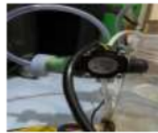
Gambar 30 Air coolant tidak mengalir melewati flowmeter

Air coolant tidak mengalir jika volume tangki radiator sudah mencapai pada ketinggian 9 cm yang secara langsung pompa akan otomatis berhenti. Bentuk fisik air coolant tidak mengalir pada selang melewati flowmeter di tunjukan pada gambar 30.