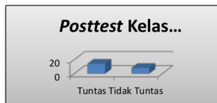
Gambar 3. Diagram Hasil Belajar ( Posttest ) Siswa Kelas Eksperimen

Setelah uji statistik selesai, siswa dikelompokkan menurut nilai posttest mereka.