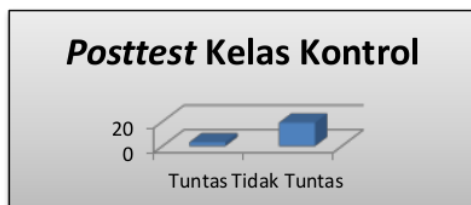
Gambar 4. Diagram Hasil Belajar (Posttest) Siswa Kelas Kontrol