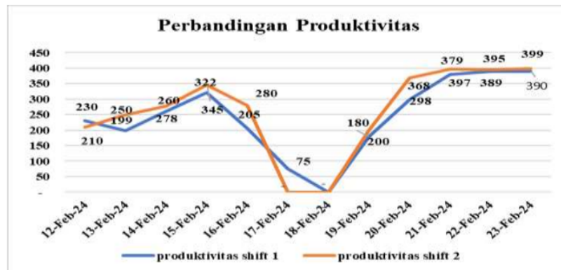
Gambar 3.2 Monitoring Produktivitas Setelah Dilakukan Improvement Redesign

Pada tanggal 17 Feb 2024 mesin sudah mulai off dikarenakan pada shift 2 akan dilakukan perbaikan. Sebelum tanggal 17 Feb 2024 mesin roasting selalu mendapatkan hasil produksi yang tidak stabil namun setelah tanggal 18 Feb 2024 mesin sudah mulai jalan dan mendapatkan hasil yang stabil dan hasil produktivitas pun meningkat.