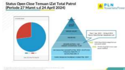
Gambar 1.2 Data Open Close UP MTW

PLN Nusantara Power merupakan perusahaan milik negara yang bergerak dibidang penyalur listrik, kegiatan perusahaan tersebut menyalurkan energi listrik bagi setiap konsumen khususnya daerah Bekasi. Mengingat bahwa PT PLN adalah salah satu perusahaan milik negara terbesar di Indonesia yang memiliki risiko kecelakaan kerja yang tinggi, khususnya pada PLN Muara Tawar yang mempunyai kunci tentang K3, yaitu Zero Accident atau tidak ada kecelakaan setiap tahunnya.