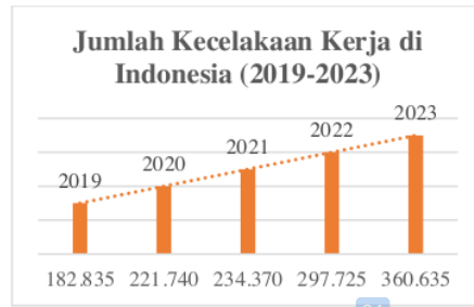
Gambar 1.1 Data Kecelakaan Kerja di Indonesia

Menurut Badan Penyelenggara Jaminan Sosial (BPJS) ketenagakerjaan mencatat bahwa setiap tahunnya, angka kecelakaan kerja selalu meningkat. Ditahun 2019 sebesar 182.835 kasus, lalu ditahun 2020 sebanyak 221.740 kasus, ditahun 2021 sebesar 234.370 kasus, kemudian ditahun 2022 meningkat 297.725 kasus, dan ditahun 2023 sebanyak 360.635 kasus. Jika disimpulkan bahwa kasus kecelakaan kerja diatas terus meningkat sejak 5 tahun terakhir, yaitu pada tahun 2019-2023 (Ketenagakerjaan, 2024).