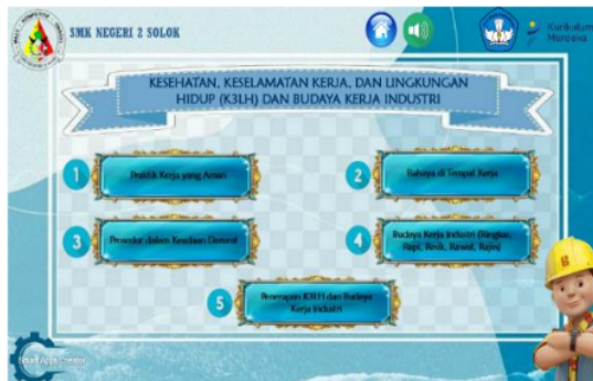
Gambar 7. Tampilan Halaman Menu Materi Elemen 5