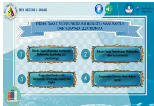
Gambar 6. Tampilan Halaman Menu Materi Elemen 4