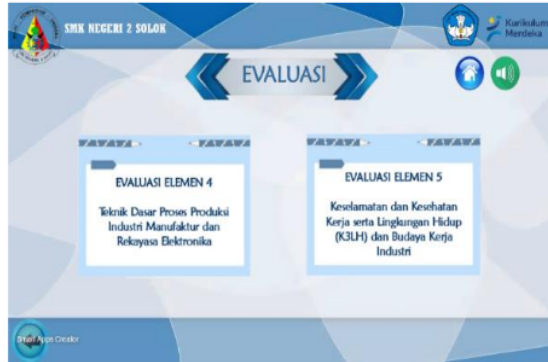
Gambar 8. Halaman Evaluasi

Halaman evaluasi ini akan mengarahkan peserta didik untuk dapat mengerjakan soal-soal evaluasi. Skor akhir evaluasi nantinya akan ditampilkan setelah pengguna selesai mengerjakan semua soal evaluasi. Halaman evaluasi dapat dilihat pada gambar 8 berikut ini.