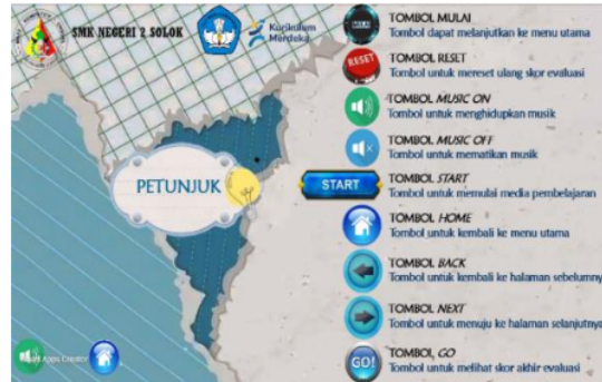
Gambar 3. Halaman Petunjuk

Pada halaman ini berisi petunjuk dari penggunaan media pembelajaran interaktif yang akan digunakan. Halaman petunjuk dapat dilihat pada gambar 3 berikut ini.