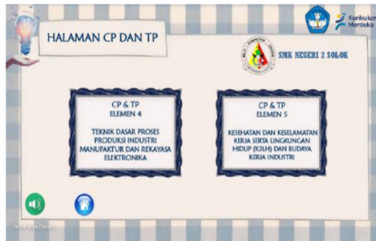
Gambar 4. Halaman CP dan TP

Pada halaman CP dan TP ini terdapat indikator atau aspek pembelajaran yang harus dicapai oleh peserta didik. Halaman CP dan TP dapat dilihat pada gambar 4 berikut ini.