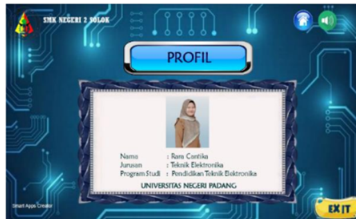
Gambar 9. Halaman Profil

Pada halaman profil ini memuat identitas dari perancang media pembelajaran interaktif. Halaman profil dapat dilihat pada gambar 9 berikut ini.