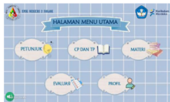
Gambar 2. Halaman Menu Utama

Halaman menu utama akan menampilkan menu petunjuk penggunaan aplikasi, menu CP dan TP, menu materi, menu evaluasi, dan menu profil. Tombol menu-menu tersebut dapat diklik oleh pengguna. Hal tersebut dapat dilihat melalui gambar 2 berikut ini.