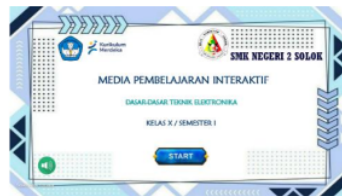
Gambar 1. Tampilan Judul dan Halaman Pembuka

Pada halaman ini terdapat judul media pembelajaran mobile interaktif, nama mata pelajaran, kelas, dan semester. Pada halaman pembuka terdapat tombol “START” untuk dapat memulai media pembelajaran interaktif. Hal tersebut dapat dilihat melalui gambar 1 berikut ini.