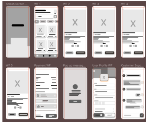
Gambar 1. Perancangan Wireframe

Gambar 1 menjelaskan Wireframe desain dari sebuah aplikasi menggunakan Figma :