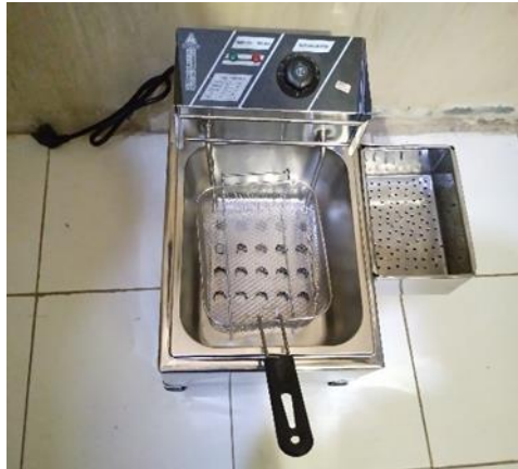
Gambar 6 Hasil Akhir Produk

Kedua, pasang peniris minyak pada samping kanan bodi mesin, dengan menggunakan paku keeling.