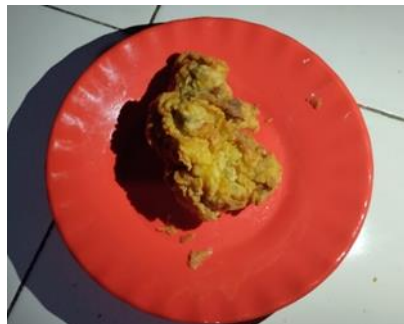
Gambar 7 Penggorengan 8 menit

Memperoleh hasil penggorengan menunjukkan chicken belum matang sempurna, dengan tekstur luar kurang renyah, warna kulit pucat, dan bagian dalam masih belum matang. Rasa belum maksimal gurih karena chicken belum mencapai kematangan optimal. Waktu 8 menit ini terlalu singkat untuk mencapai hasil yang baik.