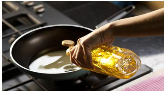
Gambar 1 Penggorengan

Penggorengan merupakan perpindahan panas dan penguapan air simultan, dimana energi panas digunakan untuk menguapkan uap air bahan bahan yang digoreng, menggunakan minyak sebagai media perpindahan kalor. Tujuan penggorengan sebagai penurunan kadar air pada bahan, dan hilangnya kelembapan selama penggorengan diakibatkan oleh penguapan selama proses penggorengan