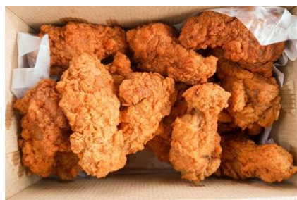
Gambar 2 Chicken