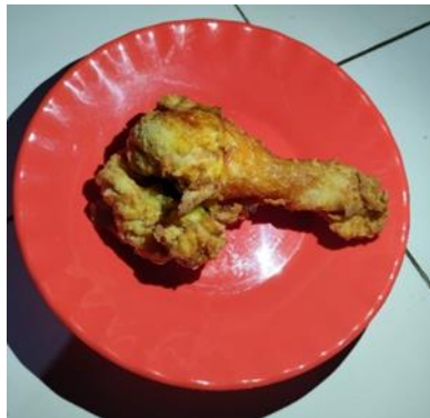
Gambar 9 Penggorengan 20 menit

Penggorengan selama 20 menit menghasilkan chicken dengan sangat renyah, tetapi mulai kehilangan kelembapan di bagian dalam. Warna coklat keemasan dan rasa gurih maksimal, ada risiko rasa sedikit pahit akibat menggoreng yang berlebihan. Waktu ini terlalu lama untuk menjaga cita rasa pada chicken .