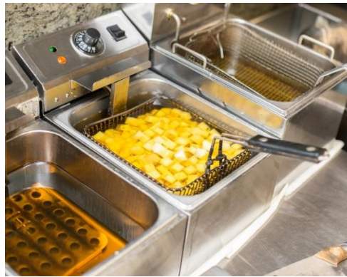
Gambar 3 Penggorengan Deep fryer

Deep fryer merupakan suatu metode memasak yang melibatkan penggunaan minyak dalam jumlah besar hingga bahan makanan terendam seluruhnya didalam minyak. Proses menggoreng terjadi oleh suhu yang lebih tinggi dari suhu didih air 170-190°C. Selama menggoreng terdapat beberapa langkah yaitu menurunkan suhu minyak goreng saat memasukkan kedalam makanan, menaikkan suhu makanan yang sedang digoreng, mengubah air yang berada di permukaan dan di dalamnya menjadi uap air, menyebabkan pengeringan baik permukaan seluruh bagian produk karena penguapan air dan penyerapan minyak. Terjadi akibat antara makanan dengan minyak, membentuk warna, rasa dan tekstur yang di inginkan