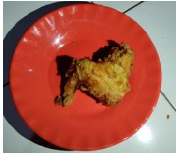
Gambar 8 Penggorengan 14 menit