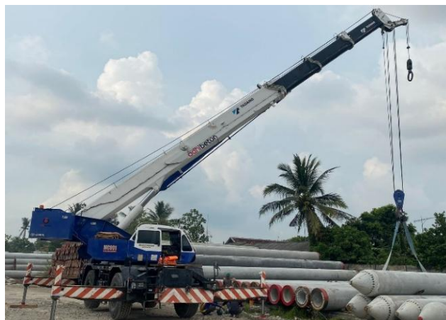
Gambar 1. Mobile Crane.

Mobile Crane berguna untuk memindahkan beban berat dalam jarak pendek, sebagai alternative yang hemat biaya daripada crane tetap yang tidak bisa berpindah, karena dapat di sewa sesuai kebutuhan dan dipindahkan antar lokasi dengan lebih mudah (Nurdiansyah, 2019; Gusthia, 2023). Alat ini dirancang sebagai alat yang mempunyai fleksibilitas dan mobilitas yang tinggi. Crane ini di lengkapi dengan boom telekospik sehingga meningkatkan jangkauan dan kapasitas angkatnya, khususnya jenis rough terrain crane yang digunakan oleh PT. Adhi Beton seperti Tadano GR-500 EXL dengan kapasitas 50 ton. Di lingkungan industri pracetak seperti PT Adhi Persada Beton Plant Purwakarta , mobile crane digunakan secara intensif untuk kegiatan pemindahan tiang pancang dari area produksi ke atas kendaraan pengangkut (kontainer), yang merupakan tahap krusial dalam rantai pasok internal pabrik.