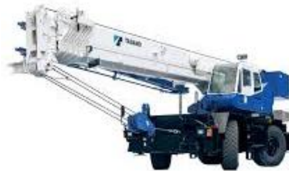
Gambar 3. Mobile Crane Tadano GR-500EXL.