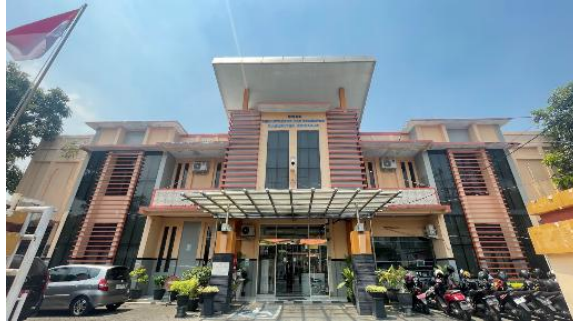
Gambar 1. Perpustakaan Umum Kabupaten Sidoarjo