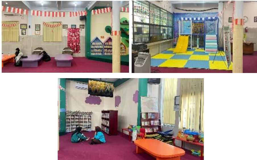
Gambar 5. Ruang Baca Anak

Keterbatasan fasilitas literasi tematik terlihat dari belum tersedianya ruang yang secara khusus dirancang untuk mendukung literasi digital, literasi kreatif, maupun literasi sains dan teknologi. Ruang baca yang ada masih difungsikan secara umum tanpa dukungan sarana teknologi interaktif atau pengaturan ruang yang fleksibel untuk aktivitas literasi berbasis kolaborasi. Ruang baca anak memang telah tersedia, namun belum didukung dengan elemen ruang yang mampu mendorong eksplorasi, kreativitas, dan pengalaman belajar yang lebih variatif sesuai dengan karakter pengguna anak.