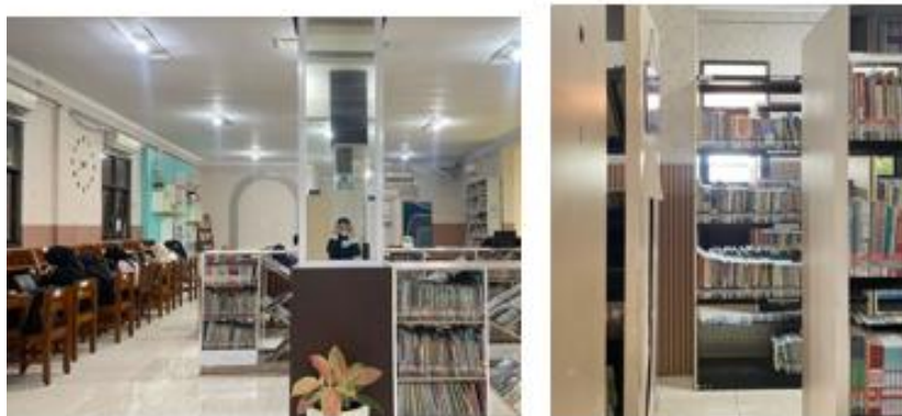
Gambar 4. Ruang Baca dan Tatanan Buku

dan tidak mendorong pengunjung untuk berlama-lama. Kondisi ini memperkuat temuan bahwa perpustakaan belum berfungsi sebagai ruang publik yang atraktif dan kompetitif dibandingkan dengan fasilitas informasi digital atau ruang publik lainnya.