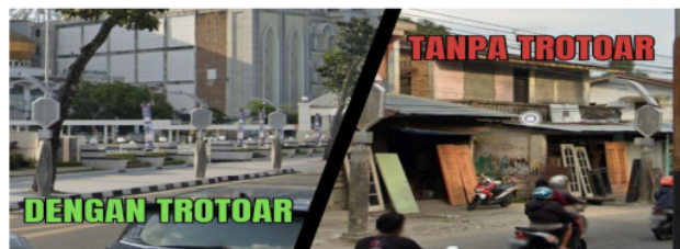
Gambar 3 Perbedaan Estetika Lampu Pocong pada Environment Trottoar

Belajar dari kasus lampu pocong yang ada di kota Medan, bahwa pembangunan fasilitas penunjang dan perlengkapan jalan raya tidak dapat semena-mena langsung melakukan instalasi fasilitas pendukung tersebut namun juga perlu diperhatikan tentang dimana fasilitas tersebut akan disandingkan atau dipasang.