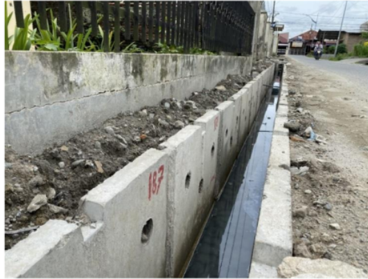
Gambar 1 Drainase Saluran Terbuka

Sistem drainase terbuka adalah suatu sistem pengelolaan air yang menggunakan saluran terbuka atau sungai terbuka untuk mengarahkan air hujan atau air limbah dari suatu area menuju tempat pembuangan akhir seperti sungai, laut, danau, atau waduk. Sistem ini umumnya digunakan dalam pengelolaan air permukaan di perkotaan maupun daerah pedesaan.