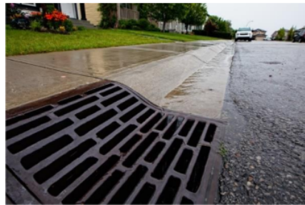
Gambar 2 Drainase Saluran Tertutup

Sistem drainase tertutup adalah suatu sistem pengelolaan air yang menggunakan saluran tertutup atau saluran pipa bawah tanah untuk mengarahkan air hujan atau air limbah dari suatu area menuju tempat pembuangan akhir seperti sungai, laut, danau, atau waduk. Berbeda dengan sistem drainase terbuka yang menggunakan saluran terbuka seperti sungai atau parit, sistem drainase tertutup menggunakan saluran pipa yang terkubur di bawah permukaan tanah.