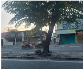
Gambar 4 Pohon Merusak Trotoar atau Median Jalan

Pemilihan jenis pohon juga dapat membantu mengatasi kerusakan yang terjadi pada trotoar, memang menanam pohon di trotoar membuat jalan lebih estetik dan rindang, sebagai usaha dalam membangun kesadaran lingkungan hijau. Akan tetapi perlu diketahui kita seharusnya menyediakan ukuran standar yang baik dalam peletakan pohon hidup pada trotoar bahkan jenis pohon harus memiliki standarnya sendiri yang mengatur agar trotoar tidak pecah dikarenakan pemekaran akar-akar dari pohon hidup yang terus berkembang.