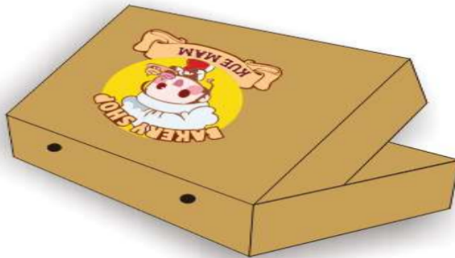
Gambar 3.3 Konsep Desain Kemasan 3.

Desain kemasan 3.3 ini berukuran 20 \times 10 \times 5 cm. Dengan penambahan lubang pada bagian belakang kemasan. Fungsi lubang pada kardus kue ini berguna untuk mengeluarkan uap panas dari kue di dalamnya agar kue tersebut tidak cepat basi atau berjamur. Pada kardus ini menggunakan material kertas duplex coklat (cwb). Kertas ini hamper sama seperti duplex akan