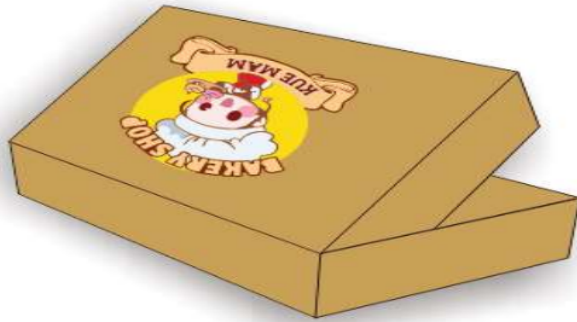
Gambar 3.2 Konsep Desain Kemasan 2.

Desain kemasan 2 ini berukuran 20 \times 10 \times 5 cm. Dengan penambahan logo agar terlihat lebih menarik dan terkesan lebih elegan. Pada kardus ini menggunakan material kertas ivory kertas ini juga termasuk kertas coated. Kertas ini biasa memiliki ketebalan 260 gr, 310 gr, 350 gr.