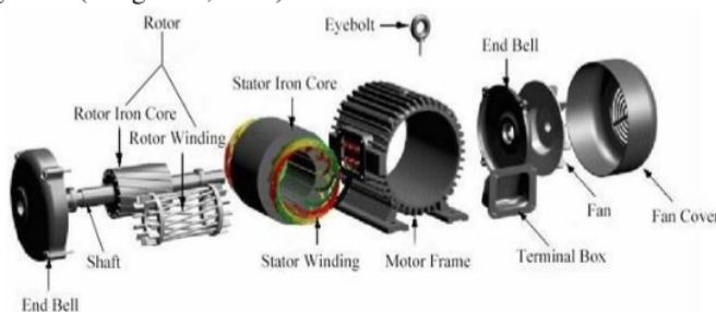
Gambar 3. Penampang membujur motor induksi

21 Medan putar pada stator tersebut akan memotong konduktor pada rotor, sehingga terinduksi arus dimana rotor pun akan turut berputar mengikuti medan putar stator. Perbedaan putaran relatif antara stator dan rotor disebut slip. Bertambahnya beban akan memperbesar kopel motor, yang oleh karenanya akan memperbesar pula arus induksi pada rotor, sehingga slip pada medan putar stator dan putaran rotor akan bertambah besar. Jadi bila beban motor bertambah, putaran rotor akan cenderung menurun dan begitu juga sebaliknya. Jika beban motor berkurang, putaran rotor akan naik pada kecepatan maksimal. Motor induksi tiga fasa memiliki tiga buah kumparan, yang setiap kumparan disuplai oleh tegangan dari setiap fasa sumber tiga fasa (Langsdorf, 2007).