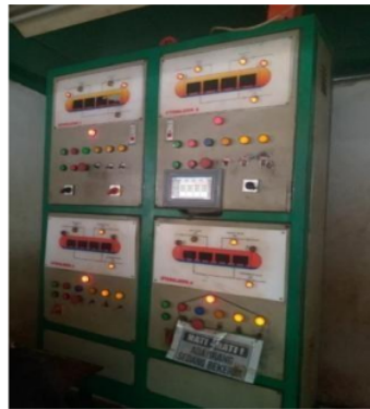
Gambar 1. Mesin Kontrol

Beberapa mesin pengering serat dilengkapi dengan sistem kontrol suhu dan kelembaban yang memungkinkan pengguna untuk mengatur kondisi pengeringan sesuai dengan kebutuhan. Sistem kontrol ini membantu dalam menjaga kondisi operasi yang optimal untuk proses pengeringan serat (Brown, 2018).