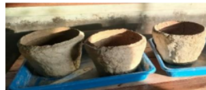
Gambar 2. Hasil percobaan 1,2,3