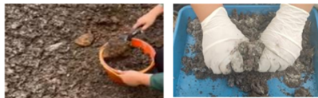
Gambar 1. Pengambilan Lumpur IPAL dan Pencampuran Bahan

Dokumentasi pembuatan pot bunga dari lumpur IPAL :