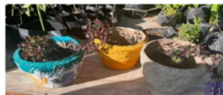
Gambar 3. Pot Bunga Yang diberi tanaman