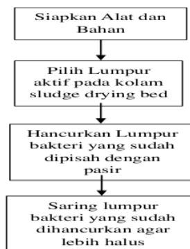
Gambar 1 Flowchart pembuatan Pupuk Organik.