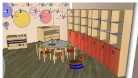
Gambar 11 Interior Ruang Bermain Anak