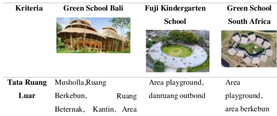
Table 1 Studi Banding Bangunan dengan Fungsi Sejenis

Penelitian terkait sekolah alam dengan pendekatan tema Arsitektur Hijau ini dilakukan dengan studi banding pada beberapa sekolah alam dengan kriteria aspek yang sama.