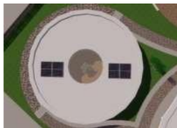
Gambar 14 Penggunaan Solar Panel

Nilai kebutuhan wattpeak : nilai daya panel surya = (359,6 wattpeak : 110 WP) = 3,26 – Dibulatkan ke bawah menjadi 3 buah modul panel surya berukuran 110 WP.