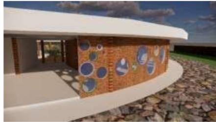
Gambar 5 Tampak Bangunan Sekolah