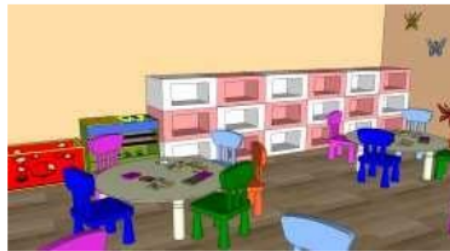
Gambar 10 Interior Bangunan ABK