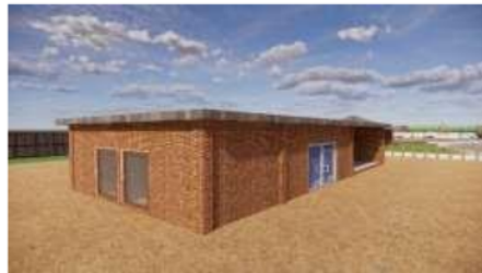
Gambar 6 Tampak Bangunan Muatan Lokal