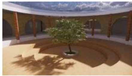
Gambar 13 Inner Court pada bangunan

Penggunaan Solar Panel juga merupakan bentuk dari Konservasi Energi pada Bangunan Sekolah Alam ini. Terdapat 3-6 pasang solar panel pada masing – masing bangunan TK, SD,serta bangunan ABK.