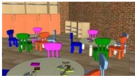
Gambar 9 Interior Bangunan TK