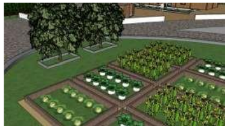
Gambar 4 Pepohonan Buah pada area Perkebunan

Jalur pedestrian sekitar bangunan menggunakan grass block, agar air tetap dapat masuk ketanah. Untuk area berkebun pada sekolah alam ini, ditanami pepohonan berbuah seperti pohon rambutan, pohon mangga, pohon jambu, yang dapat dimanfaatkan sebagai sarana pembelajaran siswa. Terdapat juga area peternakan sapi dan peternakan ayam, yang dikelilingi oleh pepohonan rindang.