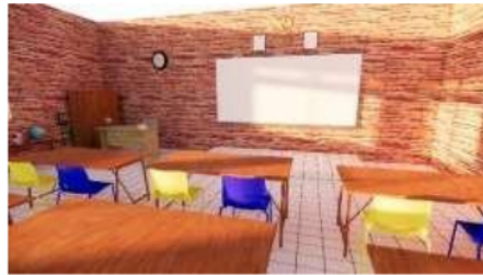
Gambar 8 Interior Bangunan TK dan SD

khusus Anak Berkebutuhan Khusus menggunakan warna yang cerah dan hangat seperti kuning dan biru.