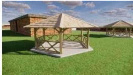
Gambar 7 Tampak Bangunan Ruang kelas Saung Sumber : Analisa Pribadi ( 2024 )