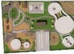
Gambar 2 Konsep Tata Massa Bangunan