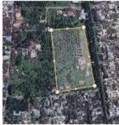
Gambar 1 Lokasi Tapak Perancangan