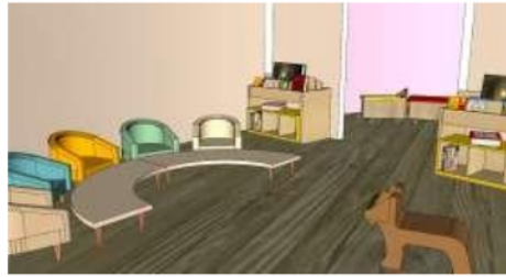
Gambar 12 Interior Ruang Bermain Anak