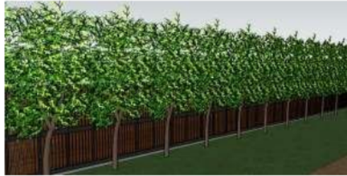
Gambar 3 Pohon Glodok Tiang pada keliling sekolah

Area landscape pada bangunan Sekolah Alam menggunakan tipe jenis pohon Ketapang Kencana, dan pohon Cemara. Pemilihan jenis pohon ini, disesuaikan dengan karakter bangunan Sekolah dan tidak akan merusak fasilitas sekolah. Selain itu, jenis pohon ini dimanfaatkan sebagai peneduh serta peredam kebisingan. Area keliling bangunan sekolah dipasang pagar kayu dan ditanami pohon Glodok Tiang yang berfungsi sebagai penyerap polusi udara dari luar bangunan sekolah.