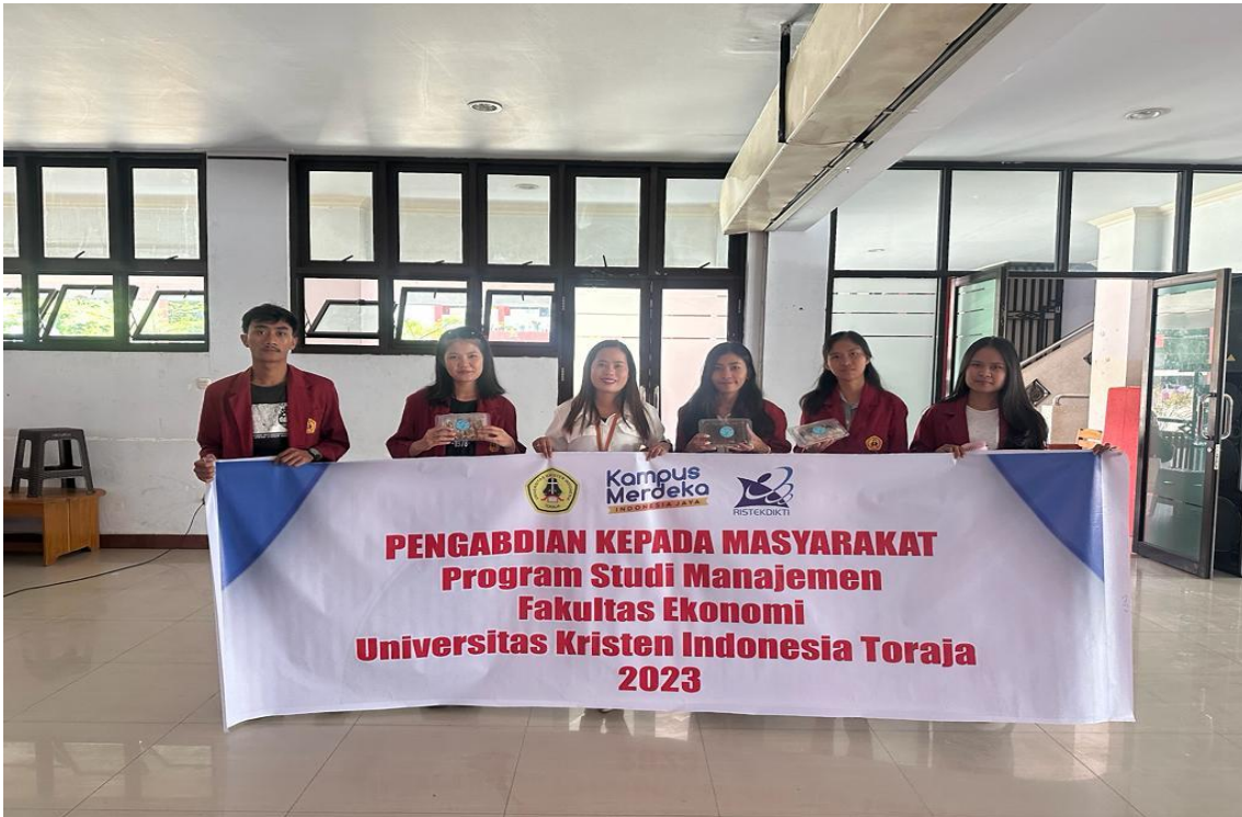
Gambar 2. Bersama Mahasiswa