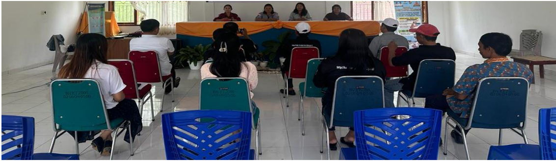
Gambar 1. Sambutan Ketua Pelaksana