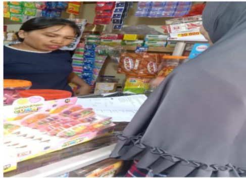
Gambar 2. Menjelaskan laporan keuangan

Gambaran secara utuh tentang perusahaan dalam periode tertentu merupakan penjelasan dari berhasil atau tidaknya kinerja perusahaan (Robain & Harianto, 2023). Hal tersebut dapat dilihat dari laporan keuangan. Adapun salah satu penelitian yang termuat dalam Journal of Trends Economics and Accounting Research menyatakan bahwa kondisi kesehatan dan kinerja dalam suatu entitas dapat dilihat dari laporan keuangan (Subroto, 2023). Dalam mengelola keuangan usaha haruslah cermat dan teliti agar keberlanjutan usaha dapat dicapai guna mendukung ekonomi (Gambar 2)