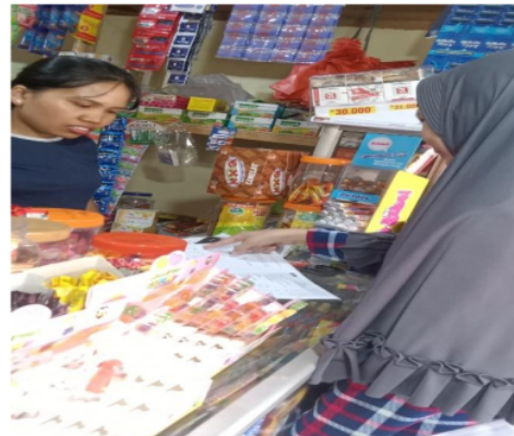
Gambar 3. Menjelaskan cara mengelola keuangan tercermin dalam laporan keuangan

Pelaksanaan PKM disambut baik oleh pelaku usaha toko X. Toko mulai memahami akan pentingnya kejelasan dalam penggunaan profit dan pentingnya pemisahan dalam kepemilikan aset (Gambar 3). Banyak pelaku usaha lain yang ingin bermitra, namun karena keterbatasan waktu maka diharapkan ilmu yang didapat dapat ditularkan ke pelaku usaha lainnya.