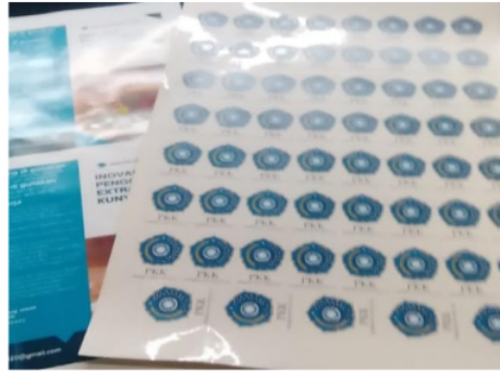
Gambar 3. Pembuatan logo dan brosur produk

Pelatihan berkolaborasi dengan masyarakat dan pihak lain untuk membuat bubuk jamu organik (bio herbal) dapat dilihat sebagai upaya untuk menghidupkan kembali dan memperkuat semangat masyarakat untuk berwirausaha sehingga meningkatkan kemungkinan hidup lebih baik. Karya yang dilakukan tidak sebatas memberikan ide saja, namun juga memberi contoh, pendampingan dan ilustrasi teknik pemasaran yang ada pada UMKM yang dilestarikan oleh masyarakat dan peserta lain yang hadir.