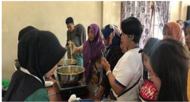
Gambar 4. Pelatihan pembuatan Bio Herbal

Pelatihan berkolaborasi dengan masyarakat dan pihak lain untuk membuat bubuk jamu organik (bio herbal) dapat dilihat sebagai upaya untuk menghidupkan kembali dan memperkuat semangat masyarakat untuk berwirausaha sehingga meningkatkan kemungkinan hidup lebih baik. Karya yang dilakukan tidak sebatas memberikan ide saja, namun juga memberi contoh, pendampingan dan ilustrasi teknik pemasaran yang ada pada UMKM yang dilestarikan oleh masyarakat dan peserta lain yang hadir.