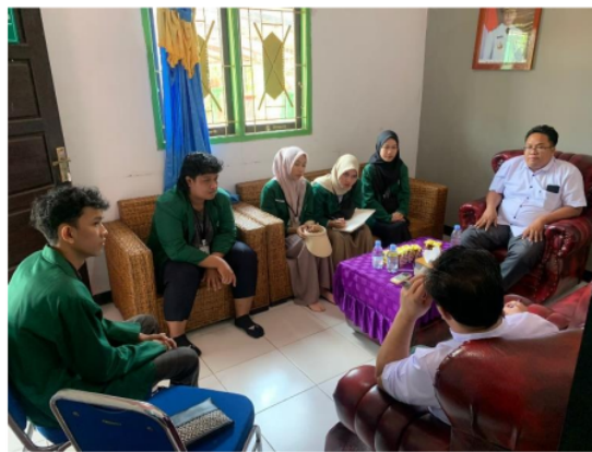
Gambar 2. Rapat pemaparan konsep kegiatan kepada pihak desa

Proses kegiatan pembuatan bio herbal dilaksanakan dalam kurun waktu kurang lebih 7 hari, yang dimulai dengan perizinan, perencanaan, dan aktualisasi kegiatan serta pembinaan lanjutan terhadap masyarakat ataupun UMKM yang ingin dengan serius melanjutkan pembuatan Bio Herbal secara mandiri maupun kelompok. 6 Pada Gambar 1 dan Gambar 2 adalah jalan nya kegiatan yang dilakukan pada saat