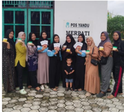
Gambar 5. Penyelesaian produk

Hasil akhir dari pelatihan mengenai Bio Herbal mendapatkan kurang lebih 238 produk dengan 14 gram isi dari setiap packaging, yang mana untuk mendapatkan jumlah produk tersebut membutuhkan 2,5 kg campuran jahe dan kunyit, 2,5 liter air dan 2,5 kg jahe. Produk yang didapatkan ini kemudian diberikan pada setiap peserta, dan alat-alat yang disiapkan oleh penyelenggara kegiatan yaitu kelompok KKN diserahkan kepada PKK Desa Pembuang Hulu II untuk nantinya digunakan sebagai alat untuk produksi lebih lanjut.