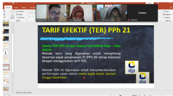
Gambar 1. Dokumentasi Kegiatan Pelatihan Perhitungan PPh 21 Menggunakan TER

Dampak Pelatihan terhadap Kepatuhan Pajak UMKM Salah satu hasil penting dari pelatihan ini adalah peningkatan kesadaran peserta akan pentingnya kepatuhan pajak. Banyak peserta yang mengakui bahwa sebelum mengikuti pelatihan, mereka belum sepenuhnya memahami kewajiban mereka sebagai wajib pajak, terutama dalam konteks PPh 21. Pelatihan ini memberikan wawasan baru mengenai pentingnya pemenuhan kewajiban pajak secara tepat waktu, yang tidak hanya membantu pemerintah dalam meningkatkan penerimaan negara, tetapi juga menjaga kredibilitas dan keberlanjutan usaha UMKM.