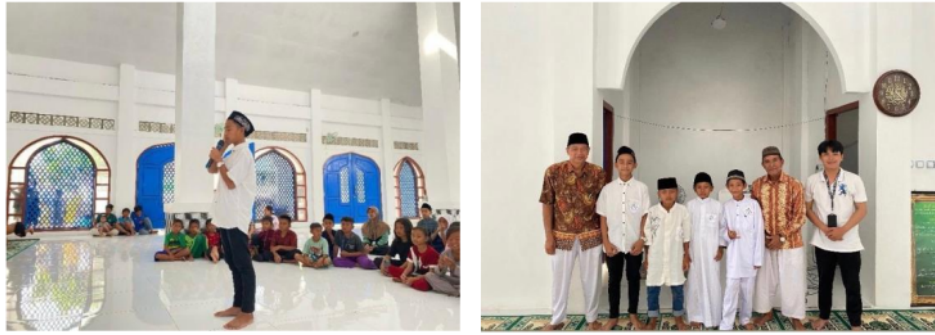
Gambar 3. Kegiatan Lomba Adzan di Masjid Jamaluddin Muara Laung II

dan memperdalam pemahaman generasi muda dalam mengumandangkan adzan, yang merupakan panggilan ibadah bagi umat muslim. Kegiatan ini mendapatkan respon positif dari masyarakat, karena mampu membangkitkan semangat keagamaan sekaligus membentuk karakter anak-anak yang lebih religius dan disiplin dalam menjalankan ibadah.