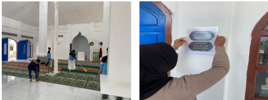
Gambar 2. Kegiatan bersih-bersih masjid dan pemasangan poster bacaan doa masuk keluar masjid, pemasangan poster niat wudhu dan doa sesudah wudhu, serta pemasangan batas suci.

Program Jumat Bersih adalah inisiatif untuk menjaga kebersihan lingkungan masjid dan sekitarnya. Kegiatan ini melibatkan Mahasiswa KKN dan bantuan anak-anak sekitar untuk bersama-sama membersihkan lingkungan, memperindah masjid, dan menciptakan suasana yang nyaman untuk beribadah. Program ini juga mengajarkan pentingnya menjaga kebersihan sebagai bagian dari iman.