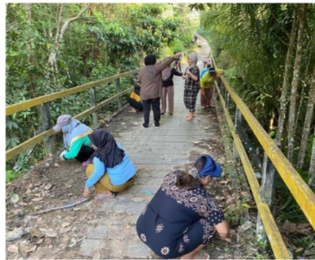
Gambar 5. Gotong Royong bersama Aparat Desa Muara Laung II