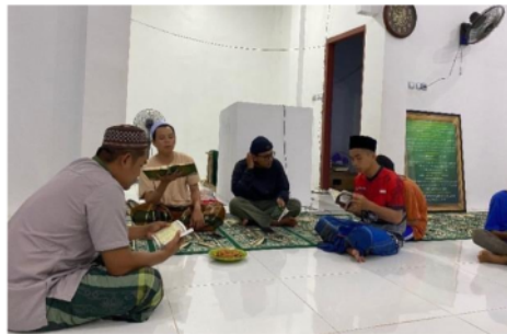
Gambar 4. Membaca Sholawat Burdah di Masjid Jamaluddin Muara Laung II

Membaca Sholawat Burdah merupakan salah satu amalan yang penuh makna dalam tradisi Islam. Di masjid Jamaluddin Muara Laung II, kegiatan pembacaan Sholawat Burdah diadakan secara rutin setiap malam Jumat. Sholawat Burdah dikenal sebagai pujian yang berisi kecintaan dan pengagungan kepada Nabi Muhammad SAW, serta doa-doa untuk mendapatkan keberkahan dan perlindungan. Kegiatan ini tidak hanya mempererat hubungan spiritual antara jamaah dengan Allah SWT dan Rasul-Nya, tetapi juga memperkuat rasa kebersamaan di antara para jamaah masjid.