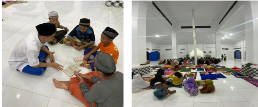
Gambar 1. Kegiatan Sholat berjamaah dan Mengajar Mengaji