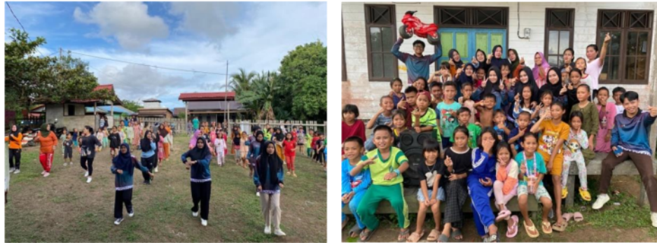
Gambar 5. Senam Sehat bersama warga Desa Muara Laung II